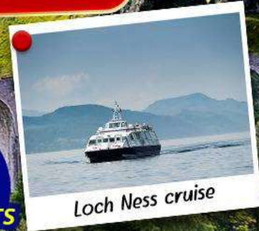
Loch Ness cruise